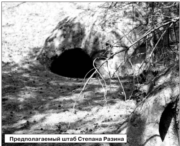
Предполагаемый штаб Степана Разина

Считается, что камни могут передавать людям свою силу, накопленную за миллионы лет. А еще помогают развить воображение: ведь каждый видит в складках и выступах что-то свое. Простор для фантазии – то, чего нам очень не хватает в обыденной жизни. Старец, черепаха, бегемот, кошка – лишь некоторые обитатели каменного города. А еще нам "встретилась" ка-