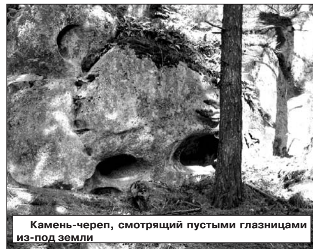
Камень-черепа, смотрящий пустыми глазницами из-под земли