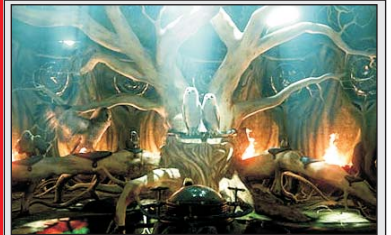
Совенок Сорен впечатлен рассказами отца-филина о мифическом отряде крылатых воинов и их великой битве с настоящим злом во имя спасения совиного королевства...

"Обитель зла 3D: Жизнь после смерти" (фантастический боевик) "Альфа и Омега 3D" (анимация) "Край" (драма) "Настоящая легенда 3D" (боевик) с 30 сентября "Морские динозавры 3D" (док. фильм) "Легенды ночных стражей 3D" (анимация)