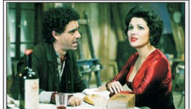
Париж, конец XIX века. Четыре друга ведут жизнь полунищей богемы, снимая одну жалкую каморку на четверых. Они решают громко отметить грядущее Рождество в своем любимом пабе, в квартирке остается только Родольфо, которому необходимо закончить статью. Он случайно знакомится с соседкой по имени Мими и влюбляется в нее с первого взгляда. Захваченные эмоциями, ни он, ни она не подозревают, что смертельная болезнь Мими скоро разлучит их...

Киноцентр "Луна" ул. Камышинская, 43а, тел. 61-10-10 с 24 сентября "Край" (драма) "Альфа и Омега 3D" (анимация) "Обитель зла 3D: Жизнь после смерти" (фантастический боевик) "Богема" (фильм-опера)