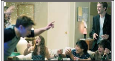
В фильме рассказывается история создания одной из самых популярных в Интернете социальных сетей - Facebook. Оглушительный успех этой сети среди пользователей по всему миру навсегда изменил жизнь студентов-однокурсников Гарвардского университета, которые основали ее в 2004 году и за несколько лет стали самыми молодыми мультимиллионерами в США...

Киноцентр "Художественный" ул. Гончарова, 24, тел.: 42-25-25, 42-09-13, www.kinocafe.su с 29 октября "Мегамозг 3D" (анимация) "Пила-7 3D" (триллер) Время сеансов уточняйте по телефону. Мультиплекс "Кинопарк" ул. К.Маркса, 4а, ТЦ "Версаль", 4-й этаж, тел.: 67-76-20, 67-84-84 с 29 октября "Мегамозг" (анимация) "Темный мир" (триллер) "РЭД" (боевик) "Стоун" (драма) "Сезон охоты-3" (анимация) "Паранормальное явление-2" (триллер) "Близкий враг" (криминальная драма) "Правосудие волков" (драма) "Социальная сеть" (драма)