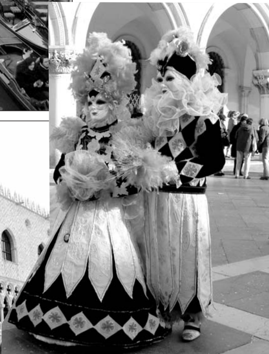
фото- и видеокамер на спокойно разгуливающих в карнавалом костюмах венецианцев. Их нельзя за это