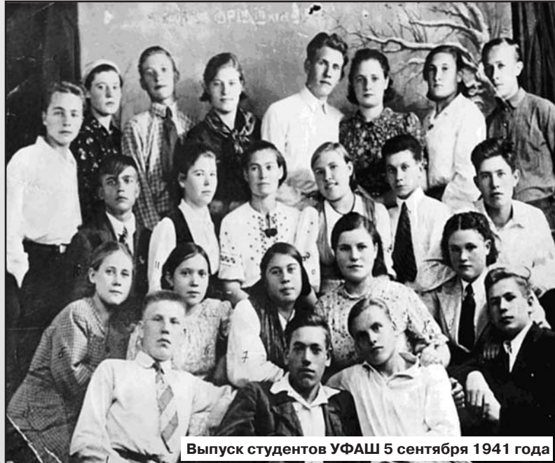
Выпуск студентов УФАШ 5 сентября 1941 года

На стенде музея медицинского колледжа УлГУ - снимок выпускников 1941 года. Для некоторых из будущих фронтовиков он стал последней мирной фотографией.