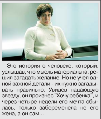
Это история о человеке, который, услышав, что мысль материальна, решил загадать желание. Но не учел одной важной детали - их нужно загадывать правильно. Увидев падающую звезду, он произнес "Хочу ребенка", и через четыре недели его мечта сбылась, только забеременела не его жена, а он сам...

ККЗ "Руслан" ул. 40 лет Победы, 15, тел. 54-14-14 с 9 сентября "Медвежонок Винни и его друзья" (анимация) "Пункт назначения-5 3D" (триллер) "Челюсти 3D" (триллер) "Беременный" (комедия)