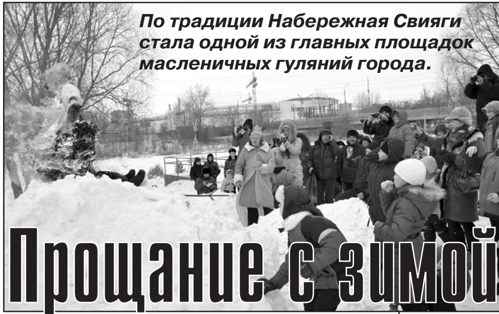
По традиции Набережная Свяги стала одной из главных площадок масленичных гуляний города.

Каждый пришедший на праздник мог найти забаву по душе. Кто-то лакомился кашей и блинами, а кто-то наоборот сжигал калории. Силачи состязались в кулачной борьбе и подьеме тяжестей. Самые ловкие пытались "покорить" столб, на верхушке которого победителя ждал приз. Дети с удовольствием катались на лошадях и играли в штурм снежной крепости. Им