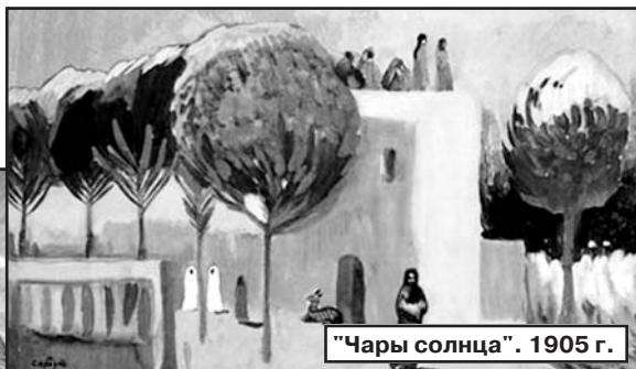
"Чары солнца". 1905 г.

в Армению на корабле произошел пожар, уничтоживший большую часть работ художника, выставившихся в парижской галерее "Жерар".