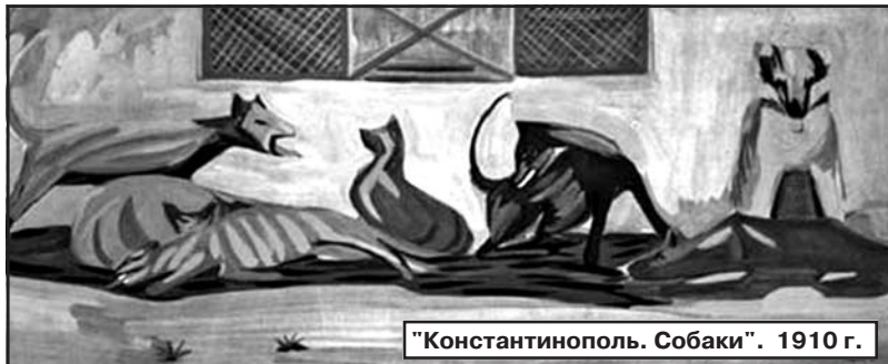
"Константинополь. Собаки". 1910 г.

менеджера, постигает иностранные языки, чтобы продвигать искусство прадеда в разных странах. Раньше сохранностью дома-музея, открыто еще при жизни дедушки, занимался отец, сейчас родовое гнездо под моим присмотром. К сожалению, дед умер, когда мне было пять месяцев, и нам не пришлось пообщаться. Осталась лишь единственная фотография, где дед держит меня на руках.