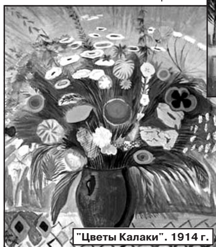
"Цветы Калаки". 1914 г.

и наглядно показывали, что искусство не является лишь имитацией реальности, а требует свободы воображе-