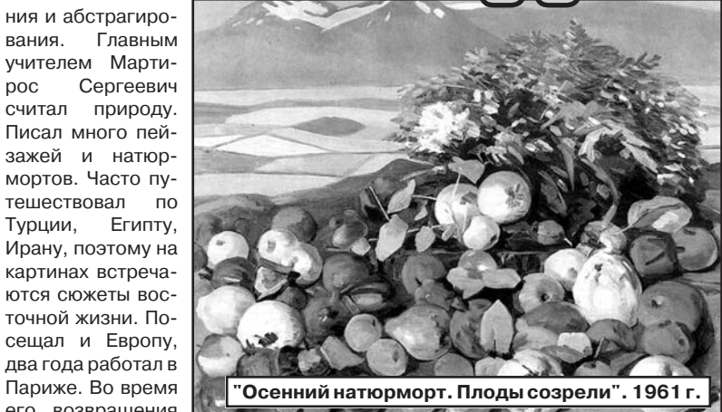
"Осенний натюрморт. Плоды созрели". 1961 г.

ния и абстрагирования. Главным учителем Мартирос Сергеевич считал природу. Писал много пейзажей и натюрмортов. Часто путешествовал по Турции, Египту, Ирану, поэтому на картинах встречаются сюжеты восточной жизни. Посещал и Европу, два года работал в Париже. Во время его возвращения