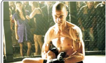
Знаменитый детектив Алекс Кросс идет по следам серийного убийцы и с удивлением обнаруживает, что почерк преступника соответствует манере действий безжалостного маньяка по прозвищу Мясник. Десять лет назад Кросс сорвал исполнение одного из его смертельных контрактов, за что Мясник убил беременную жену полицейского и бесследно исчез. Неужели он вернулся? Кросс вступает в смертельную игру...

"Синистер" (ужасы) 18+ Время сеансов уточняйте по телефону. Мультимедиа "Кинопарк" ул. К. Маркса, 4а, ТЦ "Версаль", 4-й этаж, тел.: 67-76-20, 67-84-84, www.kinocafe.su до 24 октября "Семь психопатов" (ужасы) 16+ "Монстры на каникулах 3D" (анимация) 6+ "Паранормальное явление-4" (ужасы) 16+ "Любовь с акцентом" (комедия) 16+ "Как по маслу" (комедия) 16+ "Я, Алекс Кросс" (боевик) 16+