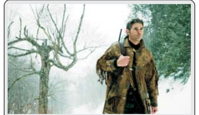
Эддисон и Лиза в бегах после неудачного ограбления казино. Бывший боксер Джей направляется домой, чтобы провести День Благодарения в кругу семьи. Судьба неумолимо сводит этих людей, чтобы они встретили Зло и вступили с ним в схватку...