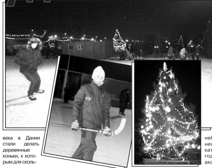
века в Дании стали делать деревянные коньки, к которым для сколь-

В русском языке название "коньки" возникло потому, что передняя часть деревянных "бегунков" обычно украшалась конской головой. Около XIV