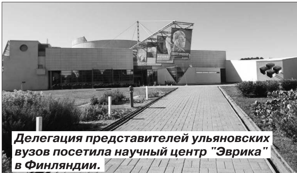
Делегация представителей ульяновских вузов посетила научный центр "Эврика" в Финляндии.

Ранее рабочая группа УлГУ побывала в музее занимательных наук "Экспериментаниум" в Москве и интерактивном музее "ЛабиринтУМ" в Санкт-Петербурге. Ученые и педагоги познакомились с направлениями деятельности, экспозиционным материалом научных городков, обсудили вопросы сотрудничества с руководством музеев. В итоге специалисты госуниверситета разработа-