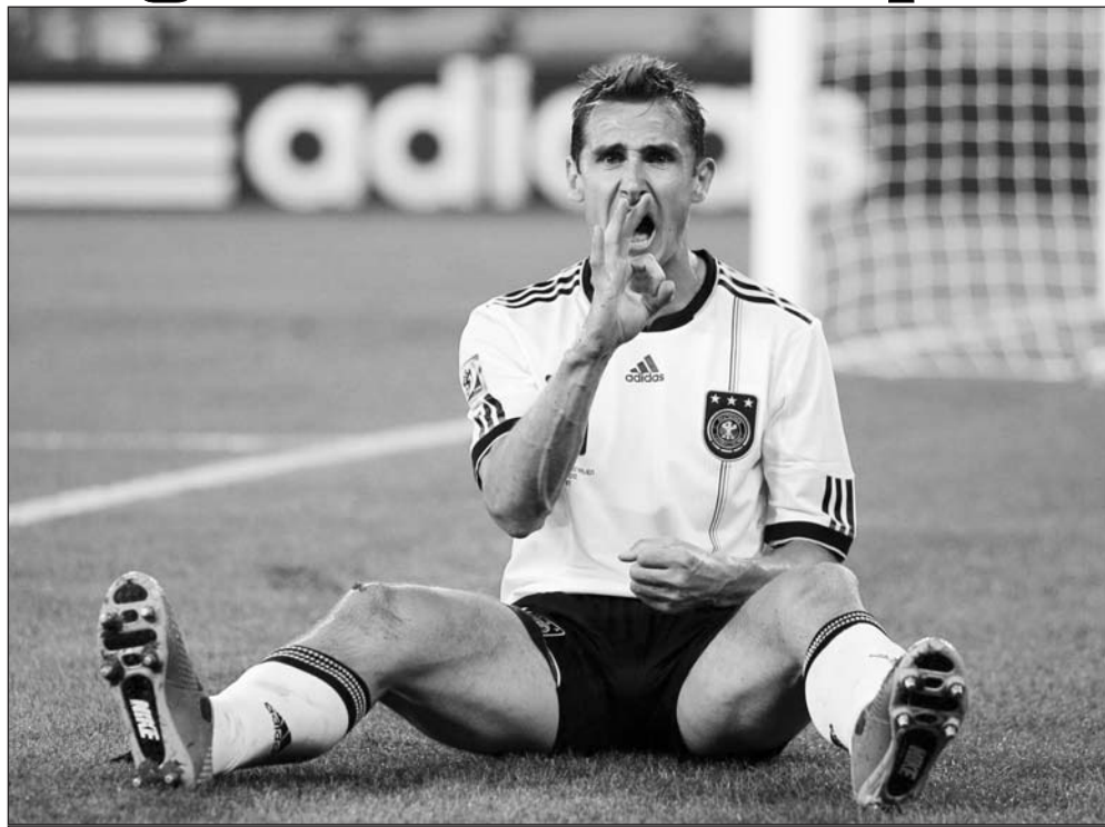
Мирослав Клозе едет в Бразилию бить рекорд Роналдо.