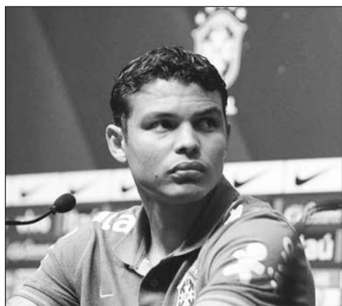
Тьяго Силва будет цементировать оборону бразильцев.

С тех пор как было официально объявлено, где пройдет ЧМ-2014, букмекеры обозначили, что именно Бразилия является главным фаворитом турнира. За прошедшие семь лет их мнение ни разу не поменялось, а, скорее, только укрепилось. Главным фактором успеха бразильцев должно стать именно домашнее поле