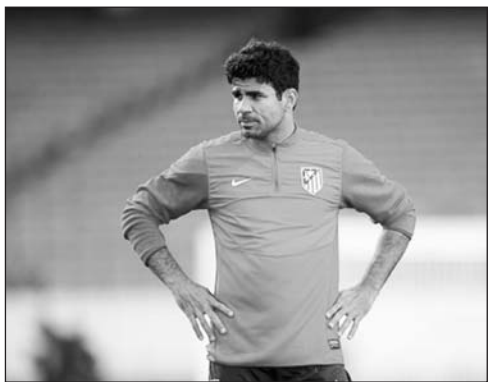
Диего Коста готовится к горячему приему болельщиков.

Действующие чемпионы мира уже не выглядят такими непобедимыми, хоть и выиграли после ЧМ Евро-2012. Из своей отборочной группы испанцы уверенно вышли с первого места по результату, но не так уверенно по игре. "Фурия Роха" помучалась и с грузинами, и с белорусами, а сборной Финляндии и вовсе подарила ничью. Окончательно миф о непобедимости испанцев был сломан на Кубке Конфедераций, где испанцы были разбиты в пух и прах бразильцами — 3:0. Но даже несмотря на все проблемы, Касильяс и К' по-прежнему являются одними из главных претендентов на победу. Команда сохранила победный костяк Евро, разбавив его новыми звездами. Одной из них стал скандальный нападающий Диего Коста, который мог выступать и за Испанию, и за Бразилию, но выбрал первых, обеспечив себе тем самым персональный горячий прием на мундиале. Многие из нынешнего состава выступали на том самом ЧМ-2010 и уже знают вкус победы и имеют достаточный опыт. И пусть главные лидеры того состава — Хави и Иньеста немного сбавили обороты, они все же остаются одними из лучших игроков мира и по-прежнему способны решить исход матча в одиночку. Защитная же линия испанцев сейчас сильна как никогда — Рамос набрал превосходную форму, Пике был лучшим из худших в провалившемся сезоне "Барселоне", а конкуренция на флангах сильна как никогда.