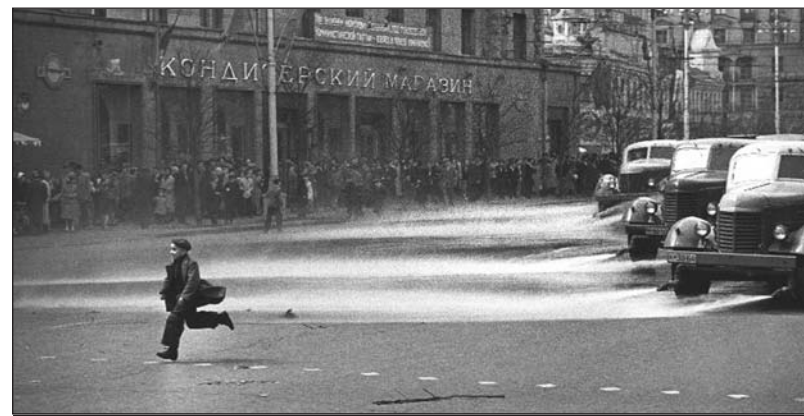
Штрихи детства. 1956 г.

меня превратившие меня из просто молодого человека в человека, который ищет и думает. Вообще слово "ду-