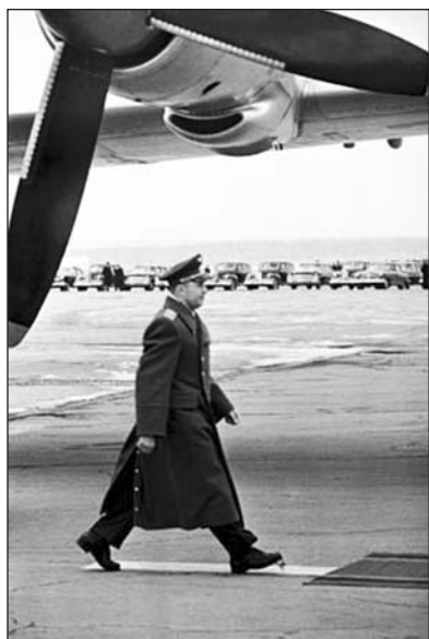
Юрий Гагарин. Внуково. 14 апреля 1961 г.

– что мои записи дробные: один сюжет, другой. И я решил писать. Но быстро понял, что склонности к писательству у меня нет. А вот рассказывать – пожалуйста. Тогда я взял диктофон и наговорил более ста рассказов в течение года. Началось с первых детских впечатлений. Знаете, какой первый натюрморт я увидел в жизни? Сорок второй год. Война. Я совсем малыш, эвакуирован из Москвы в Алма-Ату вместе с детским садиком. Очень голодное время. Я ползал по базару, собирал под ногами у людей абрикосовые косточки, и мы их ели. Иногда приходила бабушка, которая тоже приехала туда: седой, старый