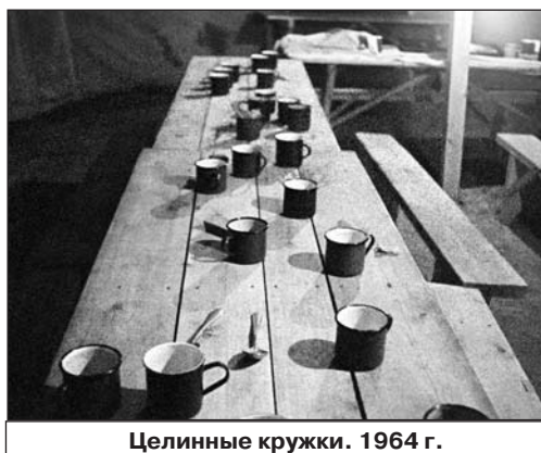
Целинные кружки. 1964 г.

– Учусь. Очень много интересных людей вокруг. Учусь у них. Сейчас в Москве готовят к изданию книгу "Без пудры и грима". Это 127 портретов и простых людей, и именитых, начиная с 56-го года. Утёсов, Шульженко, Га-