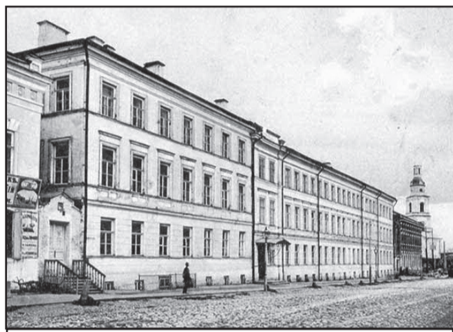
Здание Симбирской духовной семинарии.