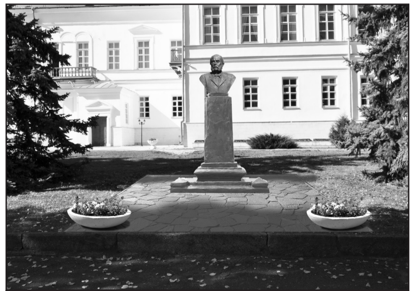
Проект размещения бюста И.А. Гончарова на Венце