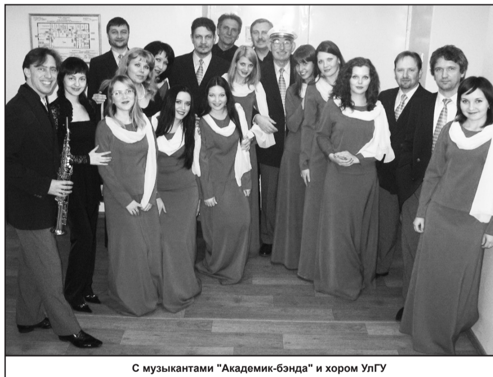
С музыкантами "Академик-бэнда" и хором УлГУ

Когда ко мне приходят студенты, я, конечно, сразу выявляю уровень их таланта. Способностями разного уровня наделен почти каждый. Однако необходимо и упорство. В наше время методика преподавания была более суровой, жесткой. Сейчас к детям относятся лояльнее, это их несколько расхолаживает.