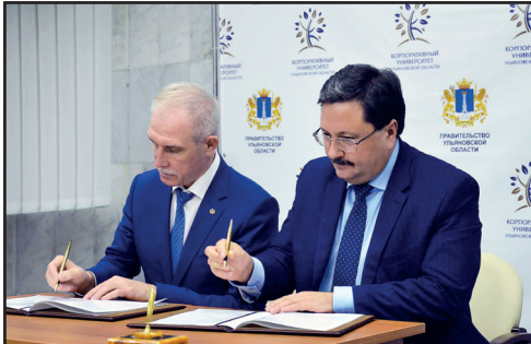
С губернатором Ульяновской области Сергеем Морозовым. Подписание стратегического соглашения о сотрудничестве УлГУ и Ульяновской области.

Повторяю, было нелегко. Но я считаю, когда человеку ком-