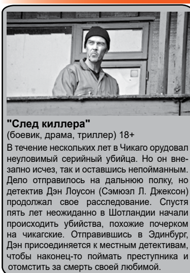
"След киллера" (боевик, драма, триллер) 18+

В течение нескольких лет в Чикаго орудовал неуловимый серийный убийца. Но он внезапно исчез, так и оставшись непонятым. Дело отправилось на дальнюю полку, но детектив Дан Лоусон (Сэмюэл Л. Джексон) продолжил свое расследование. Спустя пять лет неожиданно в Шотландии начали происходить убийства, похожие почерком на чикагские. Отправившись в Эдинбург, Дан присоединяется к местным детективам, чтобы наконец-то поймать преступника и отомстить за смерть своей любимой.